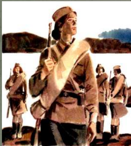
Борис Васильев А ЗОРИ ЗДЕСЬ ТИХИЕ...

В основе сюжета повести Бориса Васильева лежит реально совершённый подвиг времён Великой Отечественной войны: семь самоотверженных солдат не дали немецкой диверсионной группе взорвать Кировскую железную дорогу, по которой доставляли для Мурманска снаряжение и войска. После сражения в живых остался лишь один командир группы. Уже во время работы над произведением автор решил заменить образы бойцов на женские, чтобы сделать историю более драматичной. В итоге получилась книга о женщинах-героях, поражающая читателей правдивостью повествования.